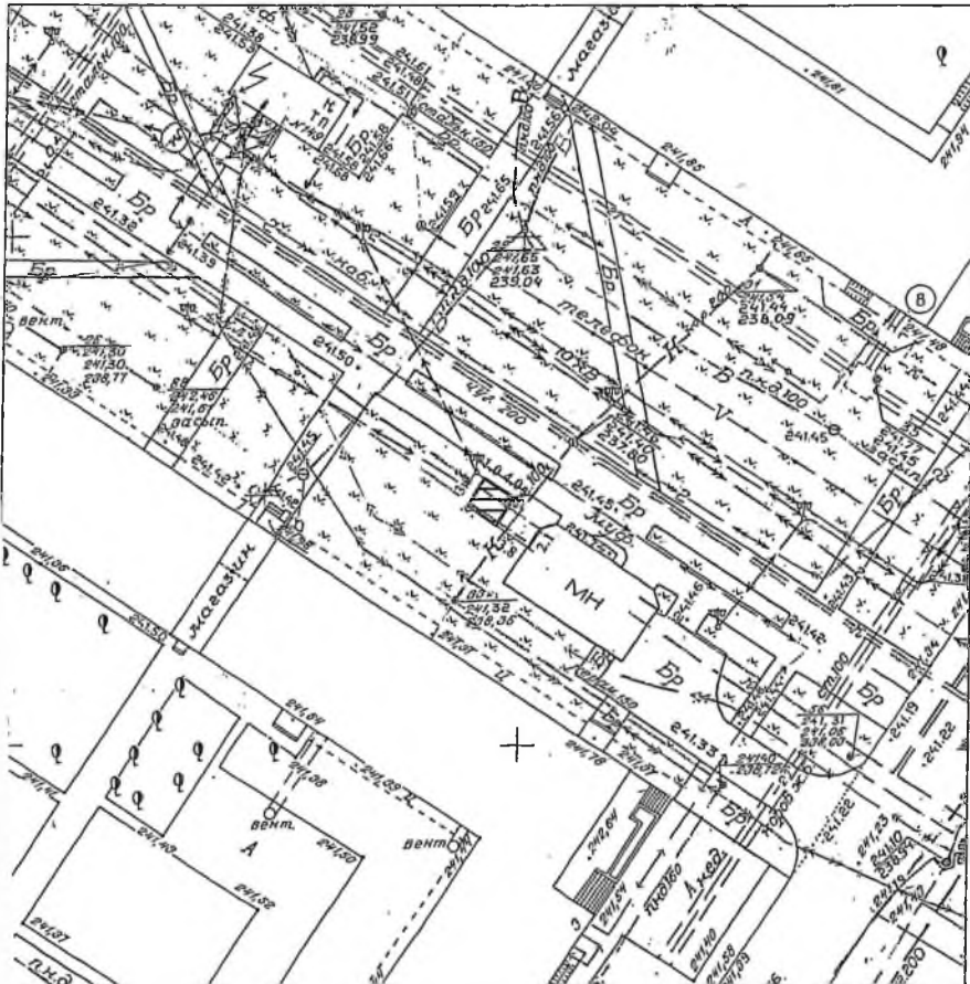
Топографическая основа в масштабе 1:500