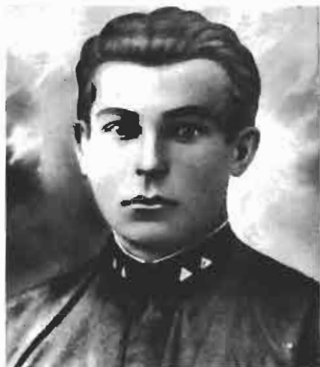
Михаил Петрович Абызов

...Обстановка под Воронежем сложилась чрезвычайно напряженной. Западнее города немецкие войска прорвали наш фронт в полосе до 300 километров и на глубину 150-170 километров, вышли к Дону и захватили стратегически важный плацдарм на левом берегу реки.