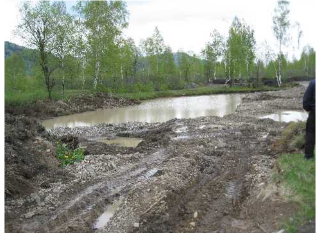
Несанкционированное размещение отходов до проверки