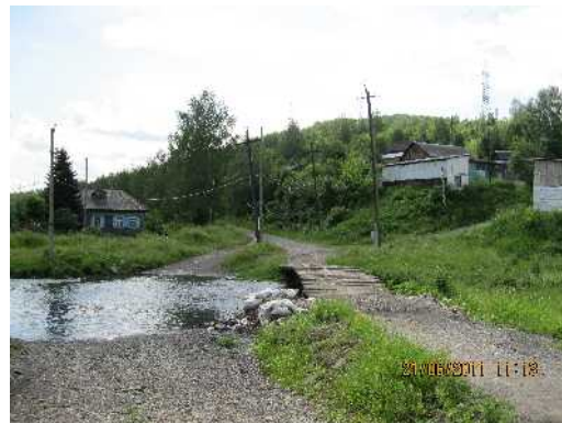
Берег реки Кийзак