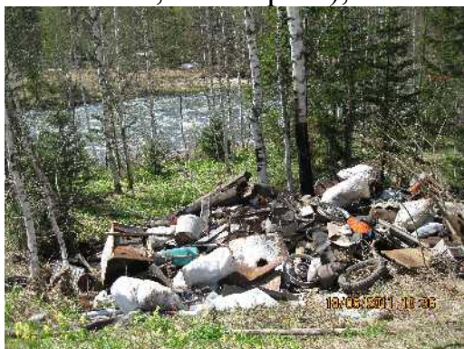
Река Белая Теба (левый приток р.Томи, 45 км выше от г.Междуреченка)

По экологическому состоянию водоохранных зон рек - 21, из них : по жалобам граждан – 3 (по захламлению в водоохранных зонах рек Томь, БелаяТеба, Ольжерасс),