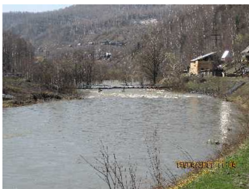
Река Ольжерасс (правый приток р.Уса)