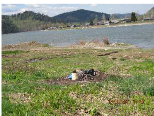
Река Томь (40 км выше от г.Междуреченска)